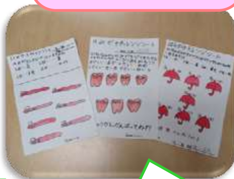
は 歯みがきチャレンジカード

朝・昼・夜、1日3回歯 みがきができたら色をぬ りました。これからも続 けていきましょう。