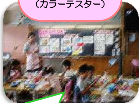
は 歯みがきテスト (カラーテスター)

1・2年生、にじいろでカラー テスターを実施しました。みんな、 どこにみがき残しがあったかをし っかりチェックしていました。