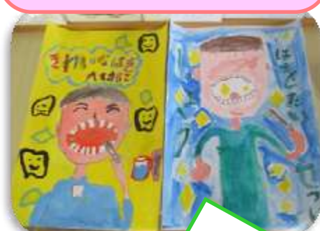
は くち けんこう かん 歯・口の健康に関するポスター

3年生に歯と口の健康に関する ポスターを描いてもらいました。 みんな素敵なポスターが出来上が りました。