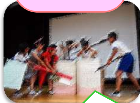
じどうほけんいんかい 児童保健委員会による 保健集会

「ハミガキ太郎、ミュートンス 退治の旅!の巻」をタイトルに歯 みがきのコツについて劇にして発表 しました。