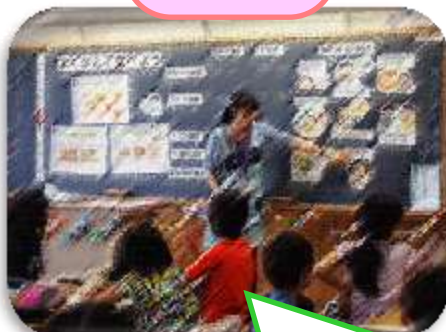
しかしどう 歯科指導

3年生では、歯によいおやつ・ 4年生では、するめとスナック 菓子を使ったかむ授業を行いました。