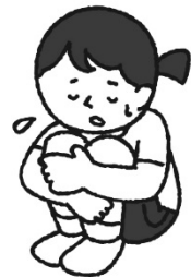
体調の悪いときはむりに 運動しない