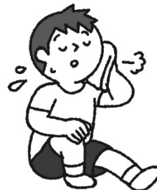
運動するときは こまめに休憩を