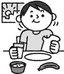
規則正しい生活で 体調管理