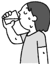
水分はこまめに、 回数を多めにとる