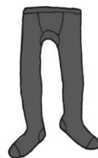
タイツ・レギンス