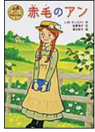
ぜんしゅう 全集コーナー