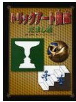
てつがく 哲学145・ミ